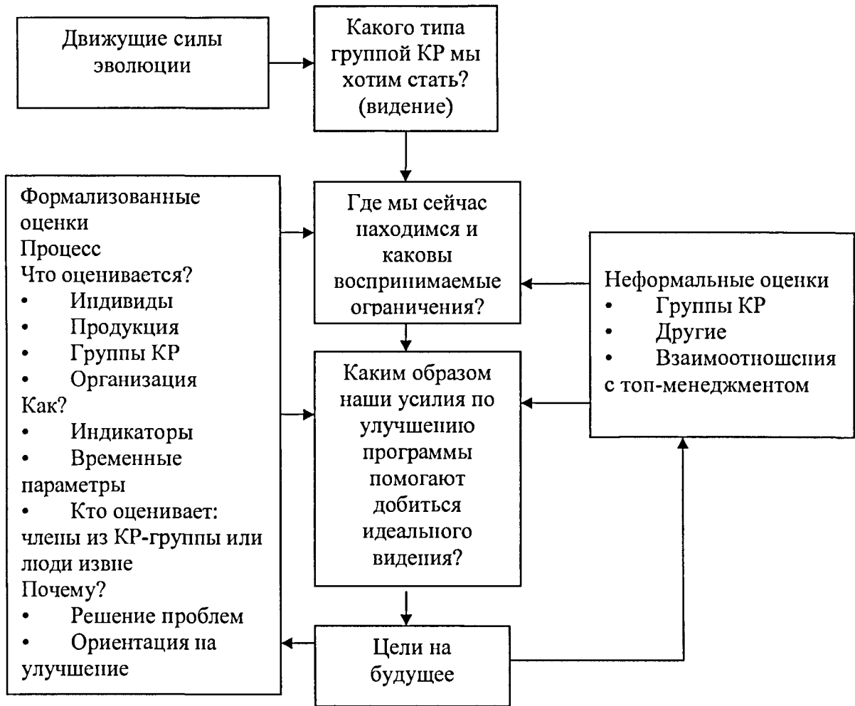
Рис. 2. Эволюция программ КР